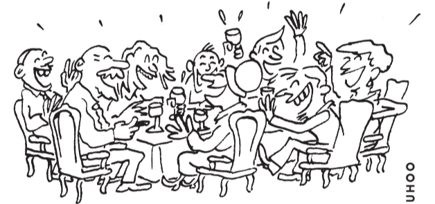
ILS EN ONT PARLÉ