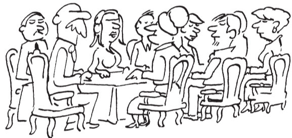
ILS ONT DIT QU'ILS N'EN PARLERAIENT PAS